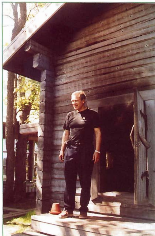
Saunasaaresta näkyy Helsingin silhuetti (ylin kuva).